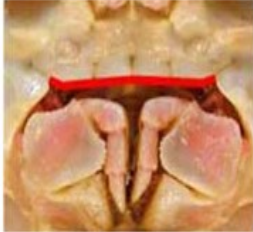
●歯がまっすぐ揃っている

最近、石川県下で話題の「大ズワイガニ」ですが「バルダイ種」という種類のもので比較的大型のもの。ベーリング海からアラスカ、カナダ方面、北海道北見、噴火湾海域に主に生息しています。ちなみに通常日本海側の「ズワイガニ」は「オピリオ種」と呼ばれるもの。味にはほとんど差は感じられません。雌も酷似していて「コウバコ」(ズワイガニの雌)と呼ばれてしまうことも。小売業界では表示の適正化を求められています。